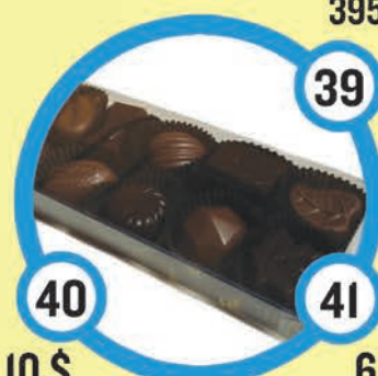
10 $ Boîte de fantaisie 150 g