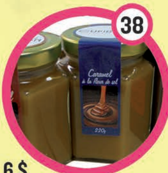
6 $ Pot de caramel à la fleur de sel 220 g