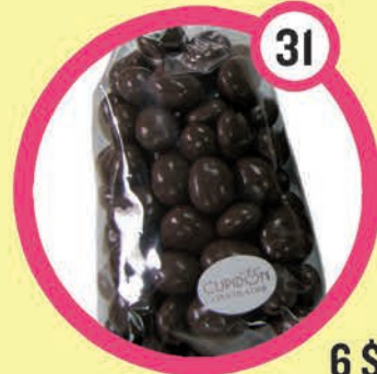
6 $ Grains de café enrobés de chocolat noir 100 g