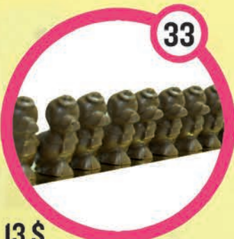
13 $ Tube de 9 canards 150 g