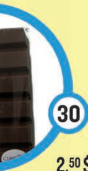
2,50 $ Barre au caramel 50 g