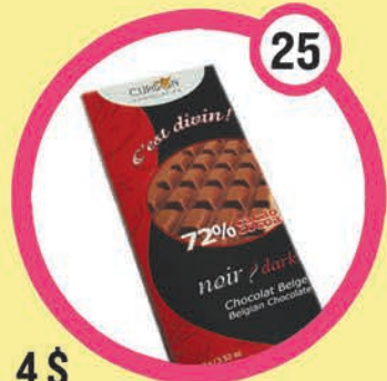
4 $ Barre de chocolat noir 72 % 100 g

Disponibles en chocolat noir ou au lait, sauf indication contraire