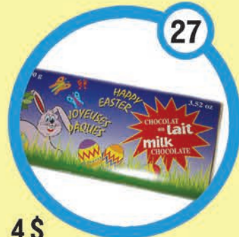
4 $ Barre de chocolat au lait 100 g