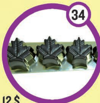
12 $ Bouchées au beurre d'érable 135 g