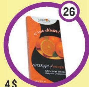
4 $ Barre de chocolat noir à l'orange 100 g