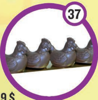
9 $ Tube de 6 poulettes 110 g