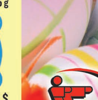
6 $ Boîte de fantaisie 100 g