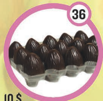
10 $ 15 mini-œufs avec brisures d'amandes