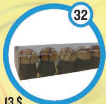
13 $ Boîte de 6 champignons 150 g