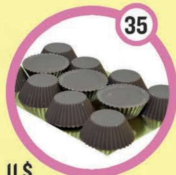
11 $ Bouchées de luxe au beurre d'arachide 150 g