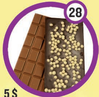
5 $ Barre de chocolat avec boules croquantes au chocolat blanc 100 g