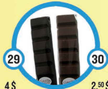
4 $ Barre de chocolat au fondant à l'érable